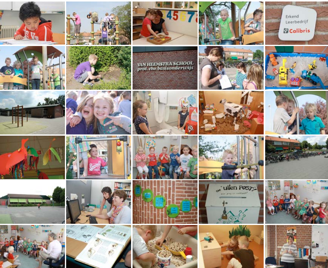
Schoolgids Van Heemstraschool 2011-2012

Van Heemstraschool | Uilennest 10 | 8051 HB Hattem | T 038-4441277; T onderbouw 038-4448142 F 038-4448141 | E vanheemstraschool@stichtingcambium.nl | www.vanheemstraschool.nl